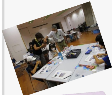
7/23 圧電教室① エレキギターをつくろう